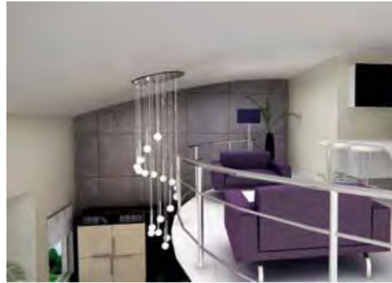
Oturma Bölümü Sitting Room