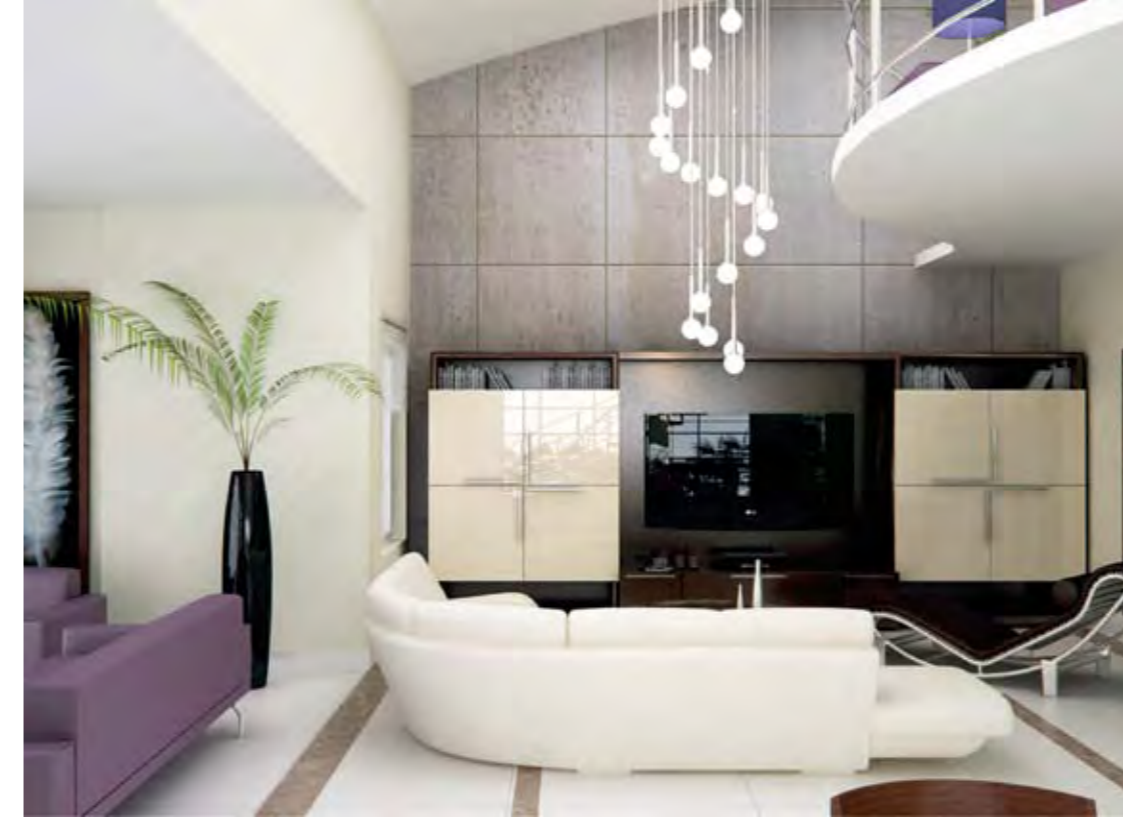
Salon Living Room