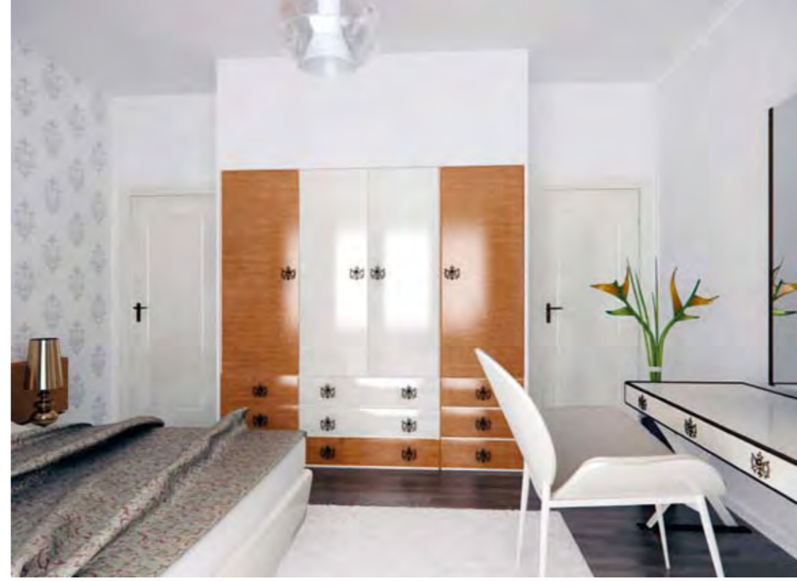
Ebeveyn Yatak Odası Parent's Bedroom