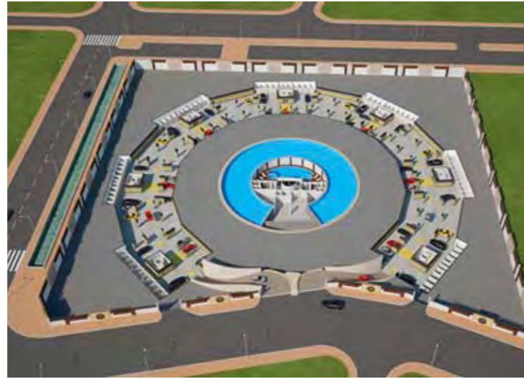
Bodrum Kat Planı Basement Floor Plan