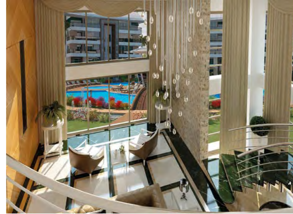
Salon Living Room