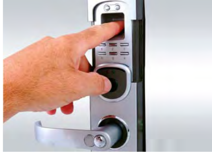
Parmak İzli Kapı Kilidi Finger Print Lock