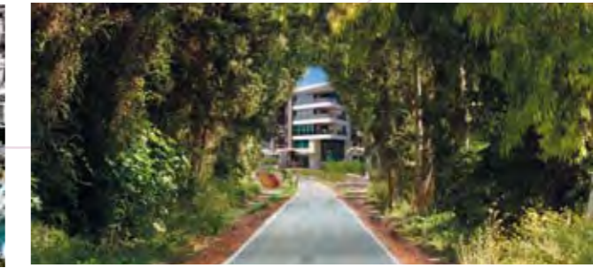
Site yanındaki orman yürüyüş yolu Forest walkway by the project