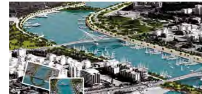
Boğaçayı Projesi Boğaçayı Project

Located in a region surrounded with green areas and prestigious housing projects, Lavanda Houses is a reliable investment with its advantageous position to access points of interest such as Konyaaltı beach, Migros Shopping Center and Saklıkent Ski Center and rapidly increasing property value thanks to the Boğaçayı Project which will start in a near future.