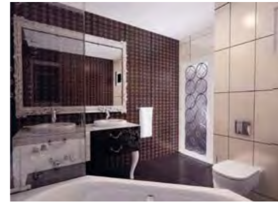
Ebeveyn Banyosu Parent's Bathroom