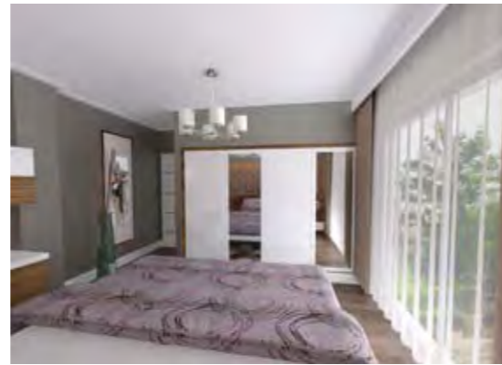
Genç Odası Children's Bedroom