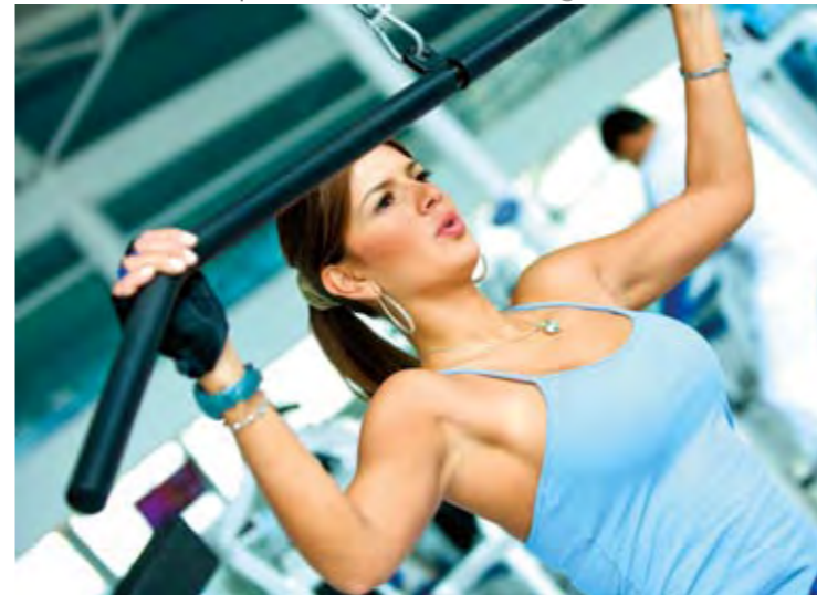
Fitness Merkezi Fitness Center