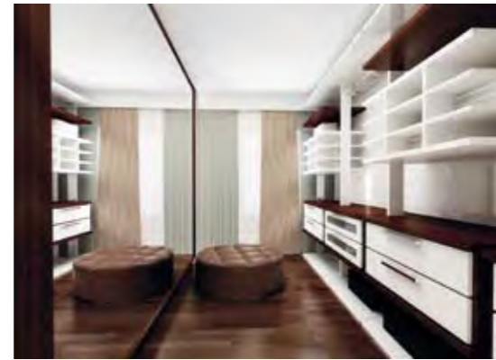
Ebeveyn Giyinme Odası Parent's Changing Room