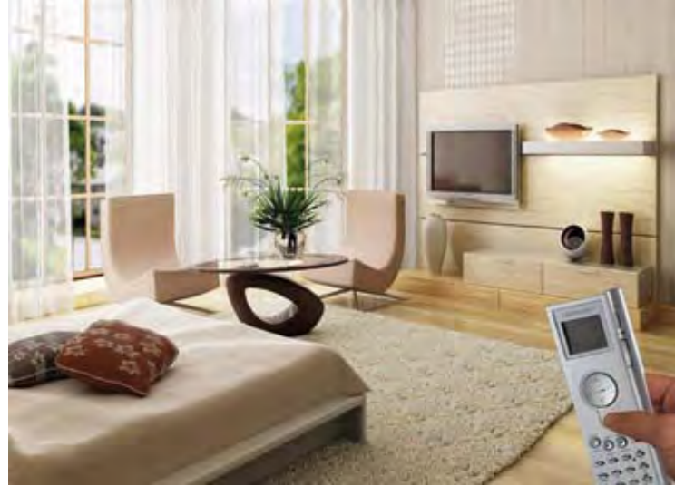
Akıllı Ev Otomasyon Sistemi Intelligent House Operation System