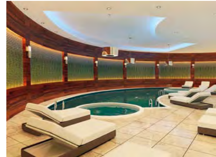
Kapalı Havuz Indoor Swimming Pool