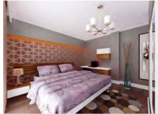
Genç Odası Children's Bedroom