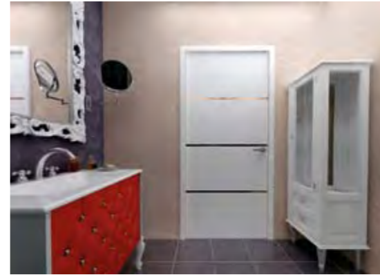
Ortak Banyo Common Bathroom