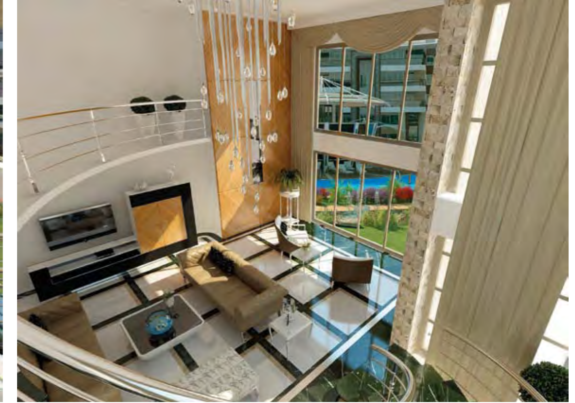
Salon Living Room