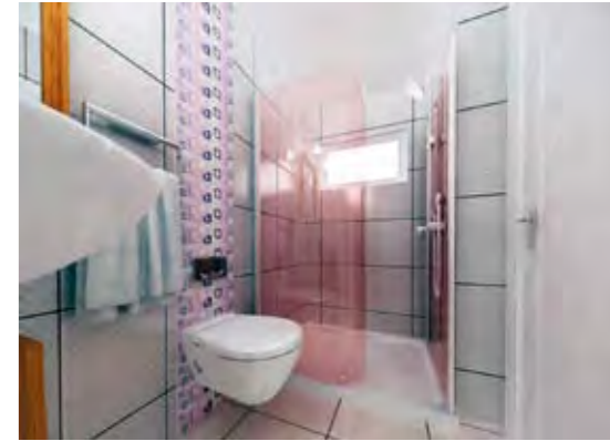
Misafir Banyosu Guest Bathroom