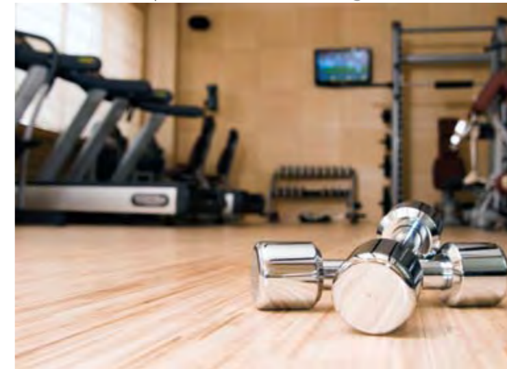
Fitness Merkezi Fitness Center