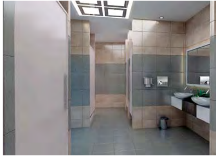
Spa Merkezi Soyunma Odaları ve WC'ler Spa Center Locker Rooms and WC