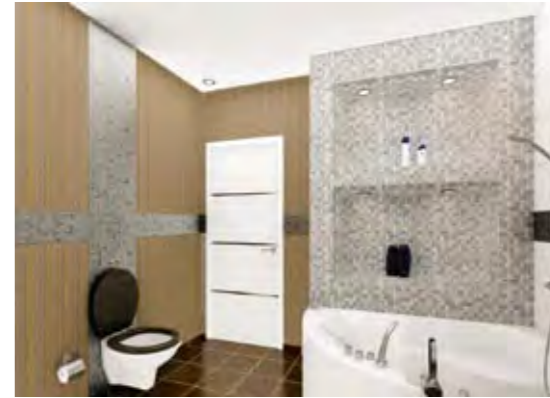
Çocuk Banyosu Children's Bathroom