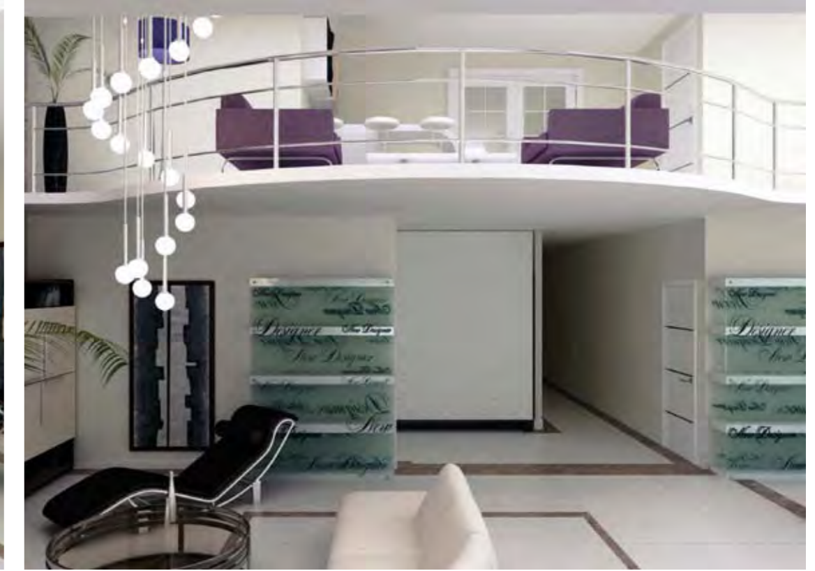
Salon Living Room