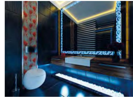
Ortak WC Common WC