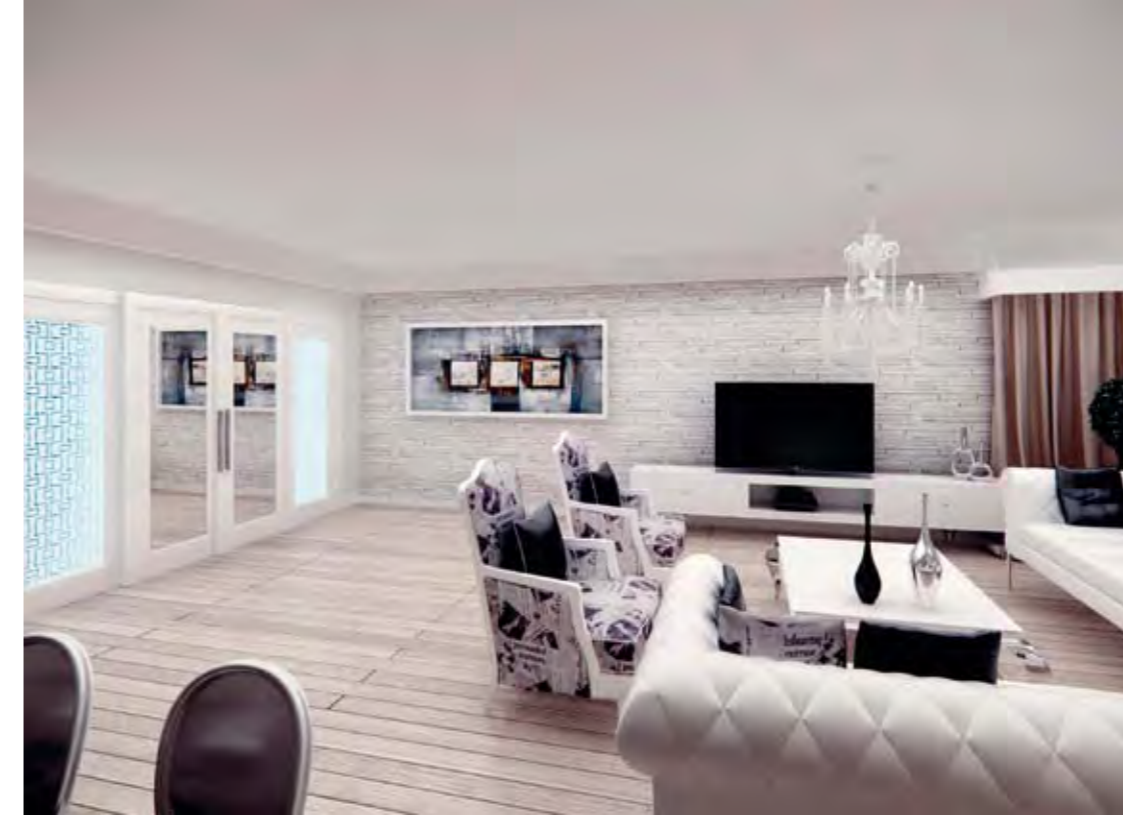
Salon Living Room