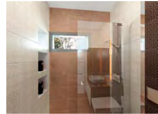
Misafir Banyosu Guest Bathroom