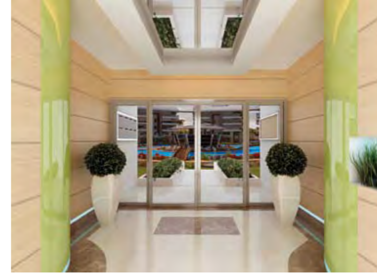
Bina Girişi Building Entrance