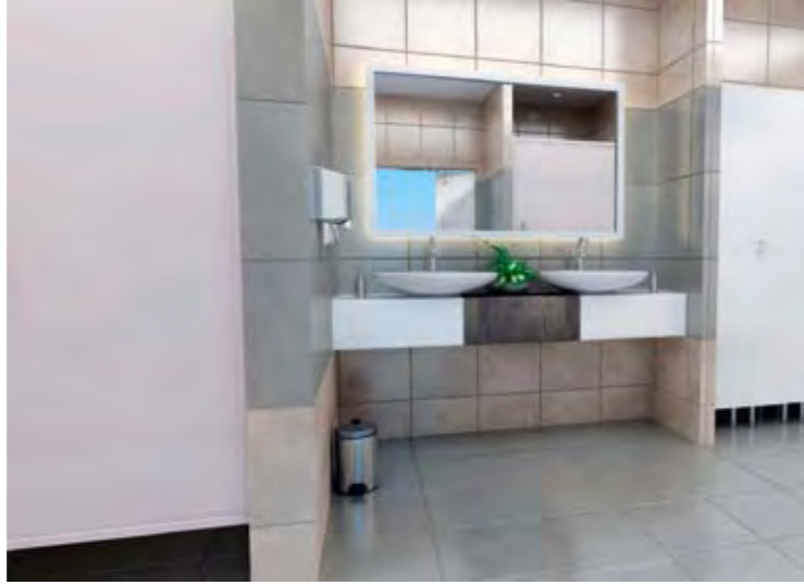
Spa Merkezi Soyunma Odaları ve WC'ler Spa Center Locker Rooms and WC