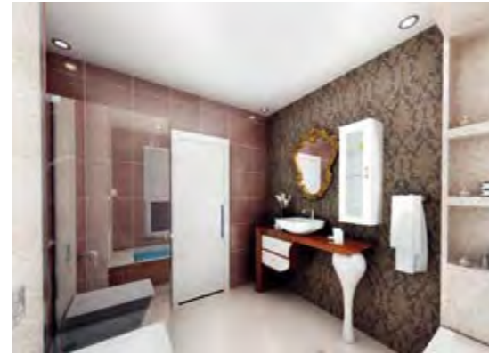
Ebeveyn Banyosu Parent's Bathroom