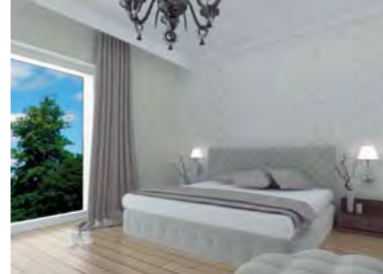
Misafir Yatak Odası Guest Bedroom