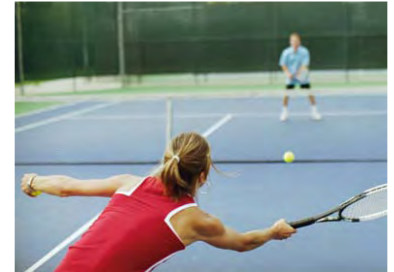
Tenis Kortu Tennis Court