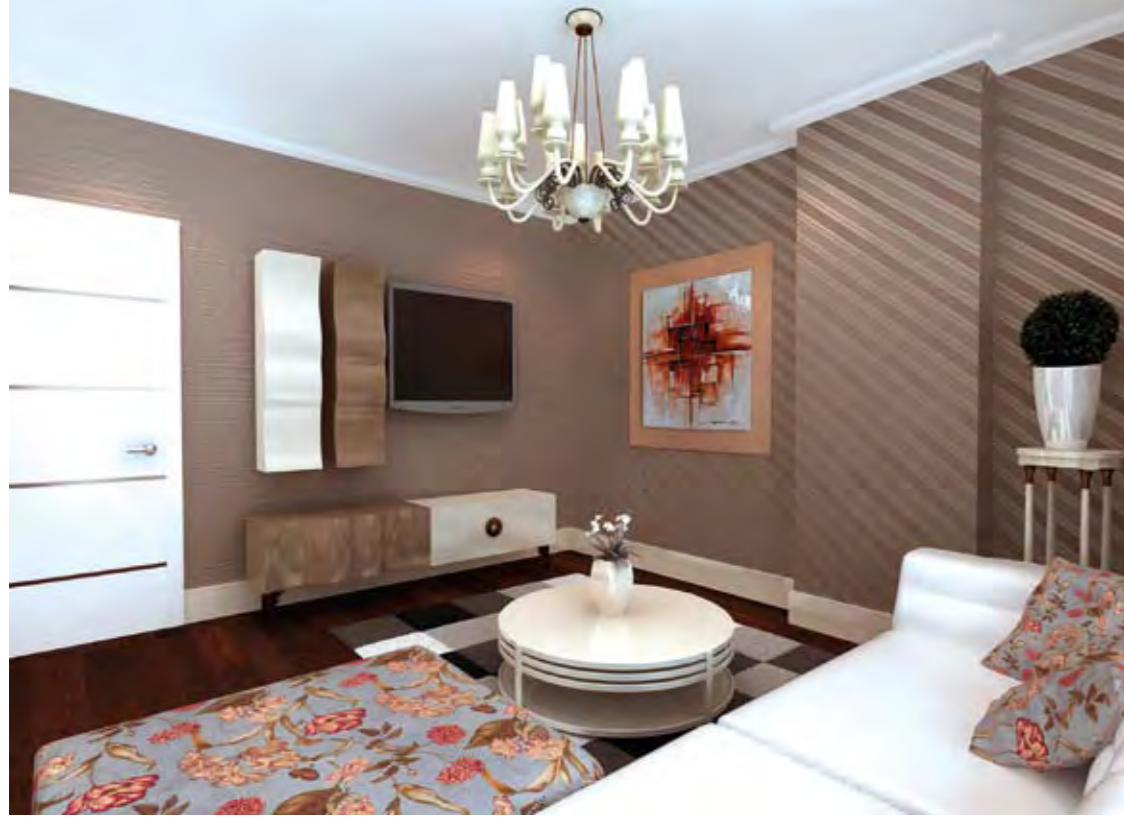
Oturma Odası Sitting Room