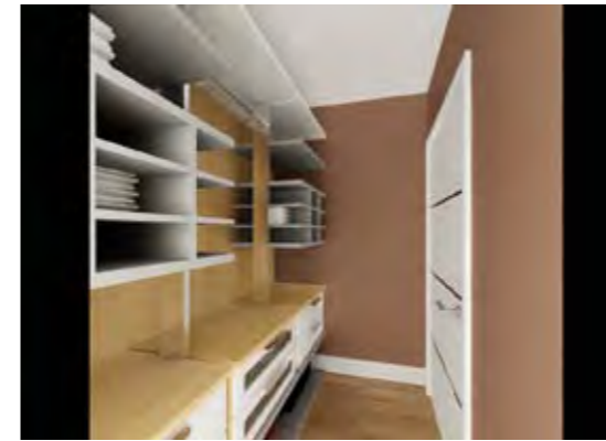
Ebeveyn Giyinme Odası Parent's Changing Room