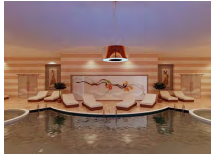
Kapalı Havuz Indoor Swimming Pool