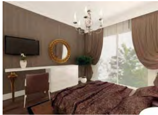
Salon Living Room