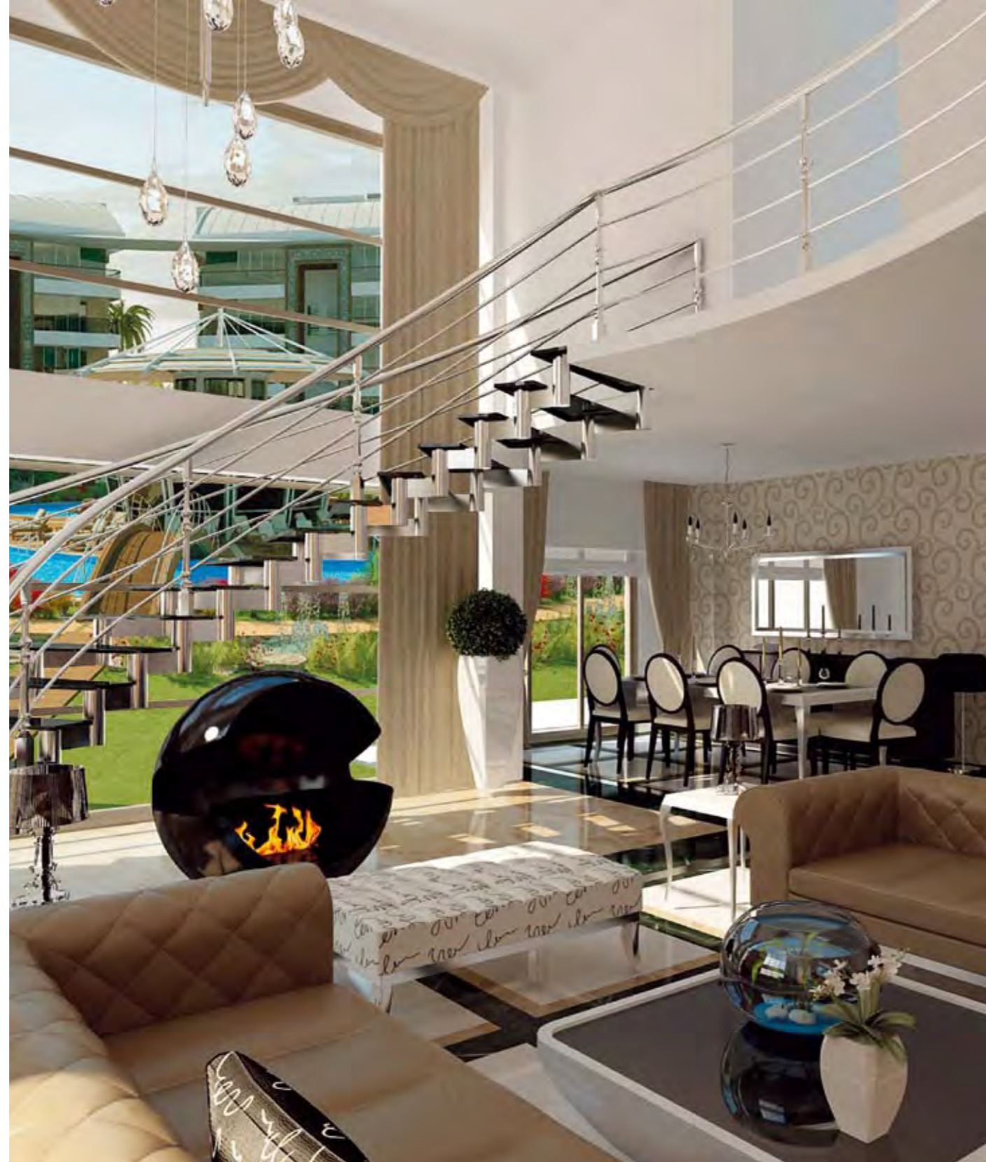
Salon Living Room

METRAJA ORTAK KULLANIM ALANLARI DAHİL EDİLMEMİŞTİR. COMMON USAGE AREAS ARE NOT INCLUDED IN THE DIMENSIONS.