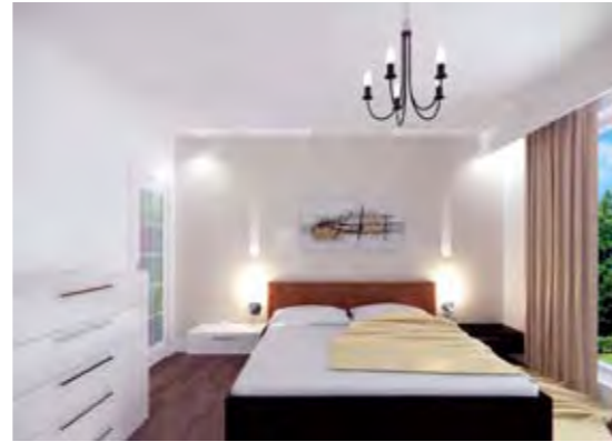
Misafir Yatak Odası Guest Bedroom