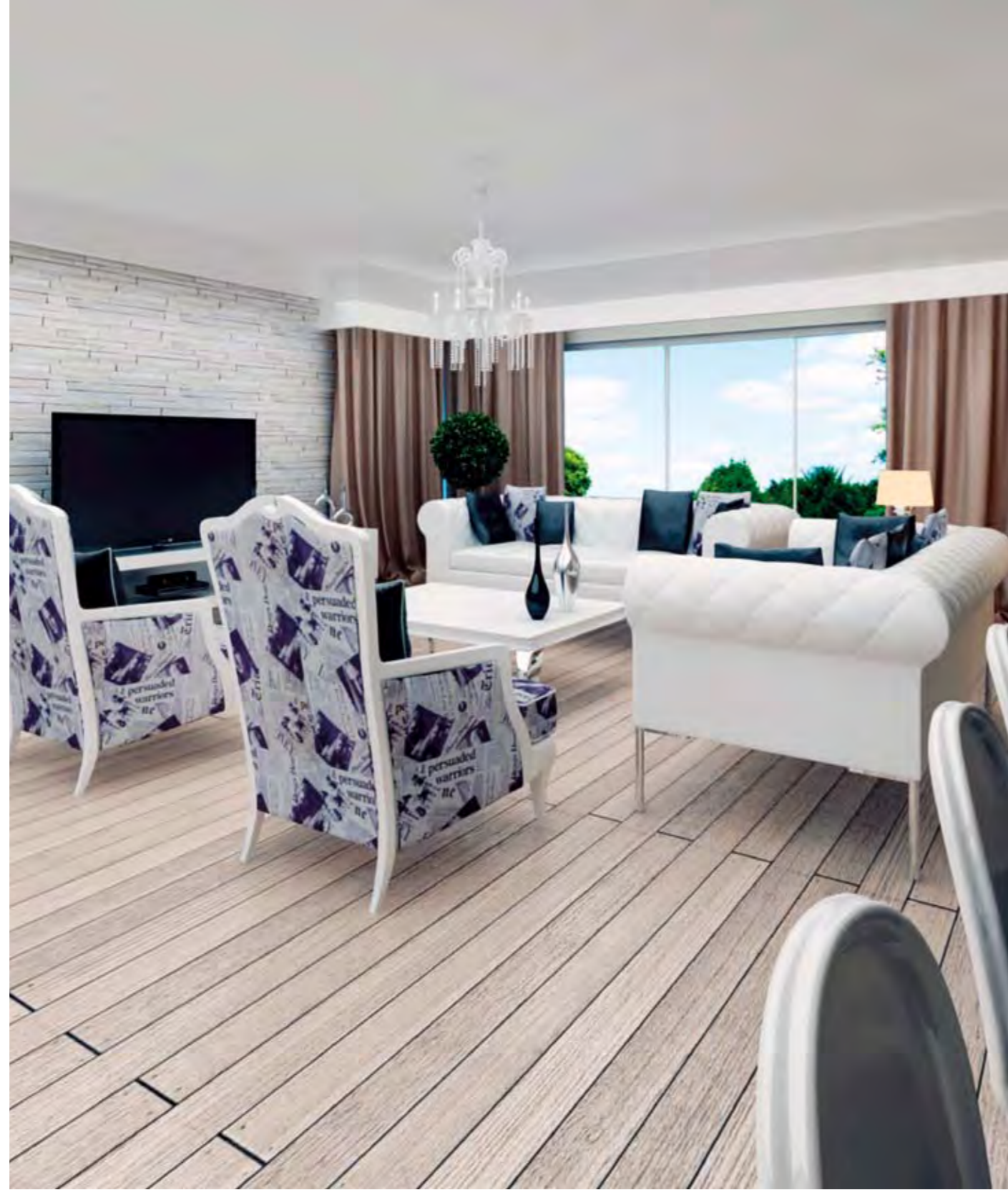
Salon Living Room

METRAJA ORTAK KULLANIM ALANLARI DAHİL EDİLMEMİŞTİR. COMMON USAGE AREAS ARE NOT INCLUDED IN THE DIMENSIONS.