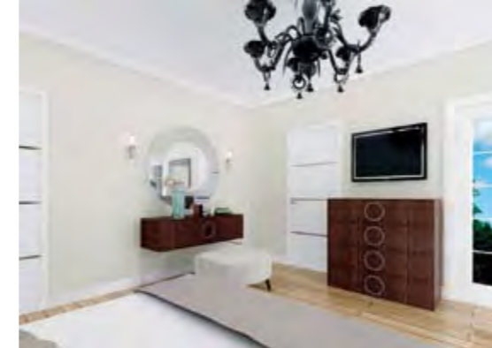
Misafir Yatak Odası Guest Bedroom