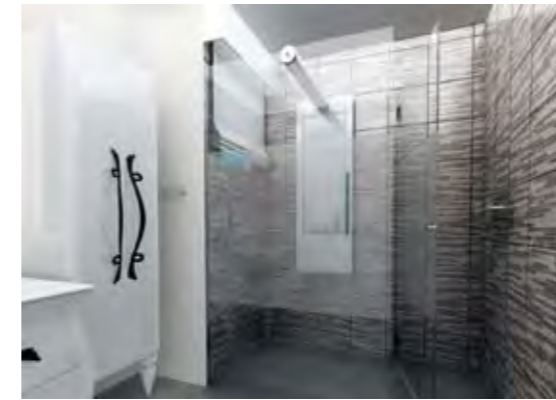
Ortak Banyo Common Bathroom