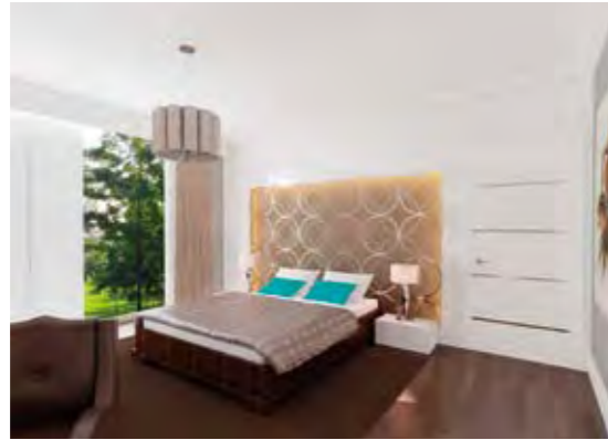
Ebeveyn Yatak Odası Parent's Bedroom