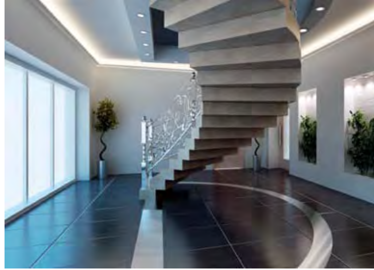
Spa Merkezi Girişi Spa Center Entrance