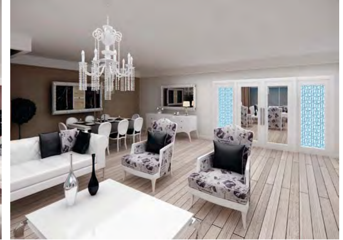
Salon Living Room