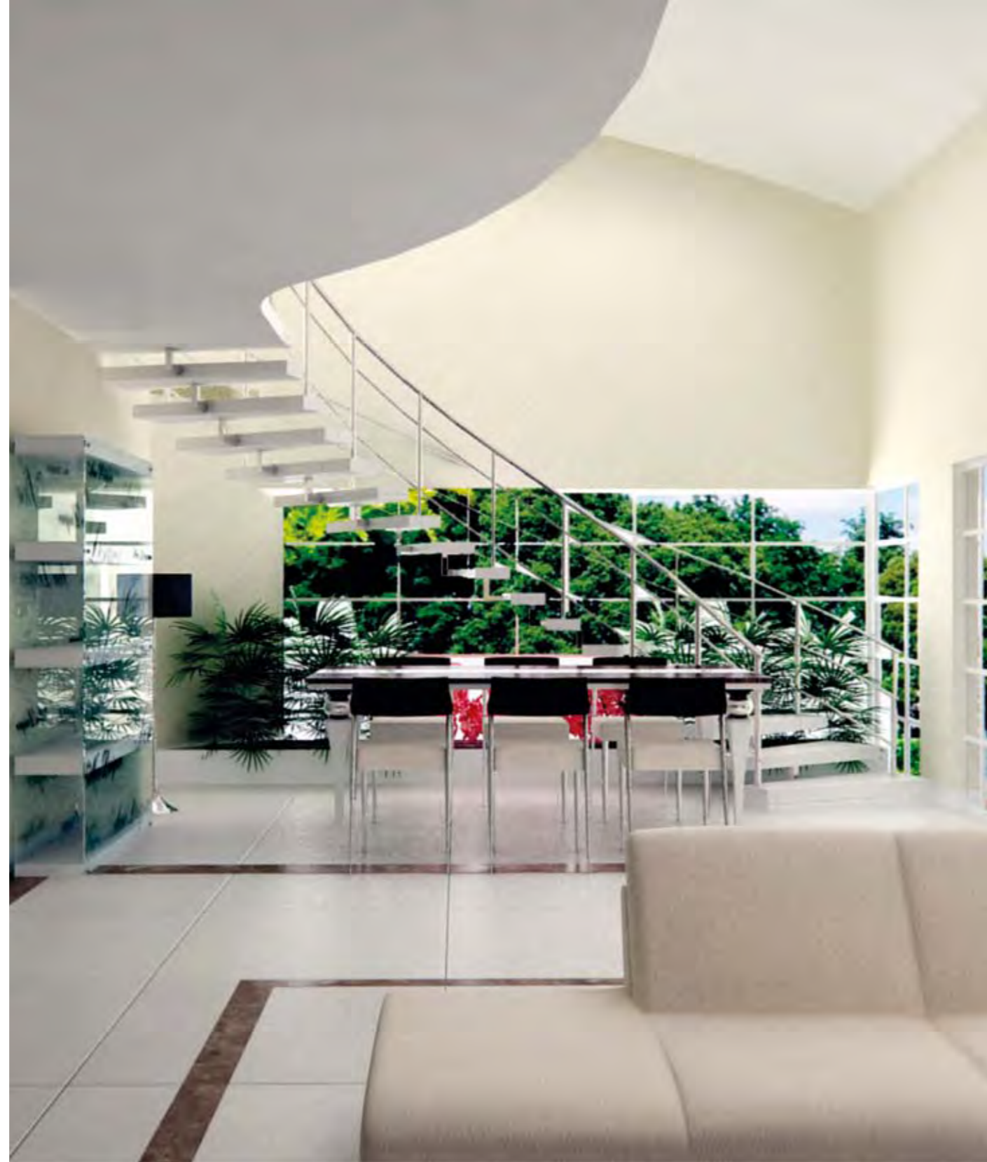
Salon Living Room

METRAJA ORTAK KULLANIM ALANLARI DAHİL EDİLMEMİŞTİR. COMMON USAGE AREAS ARE NOT INCLUDED IN THE DIMENSIONS.