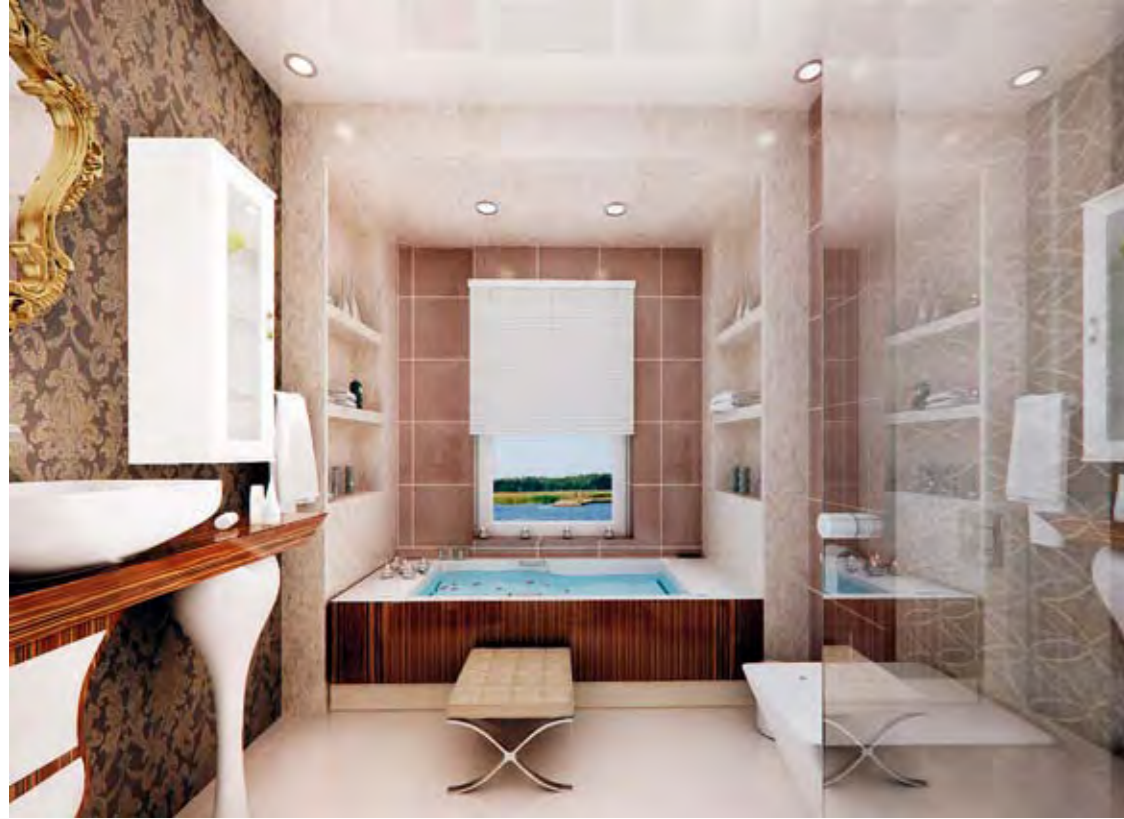
Ebeveyn Banyosu Parent's Bathroom