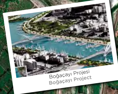
Boğaçayı Projesi Boğaçayı Project